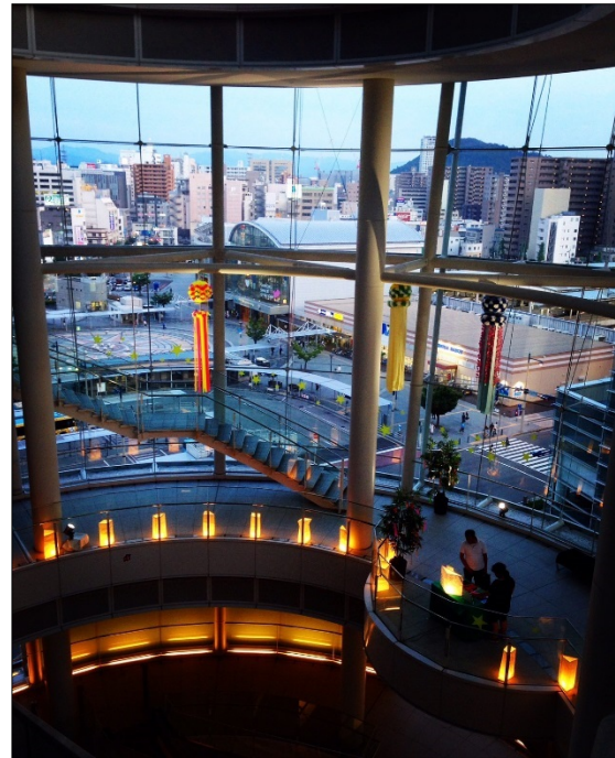
▲ 展示イメージ (オリーブタワー5階吹抜空間)