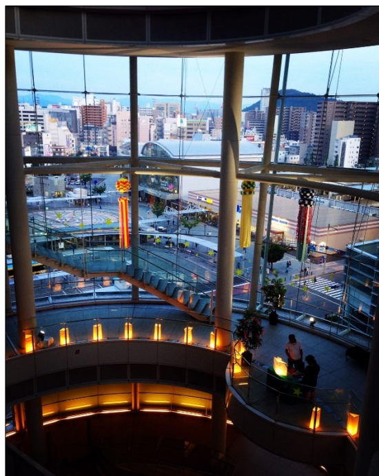
▲ 昨年の様子（オリーブタワー5階、今年は設置階や装飾方法が変更となります）