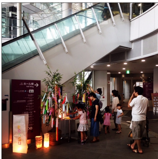
▲ 昨年の様子（オリーブタワー1階）